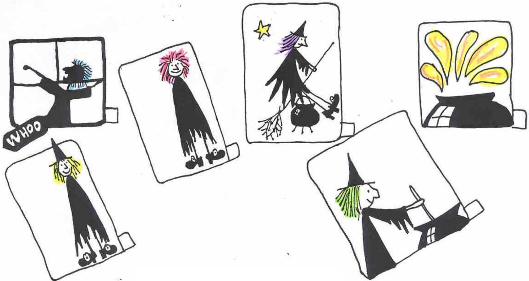
FIGURA 1 VIÑETAS