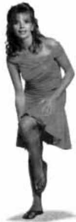
Victoria Abril, 34 años, nueva musa y protagonista total.