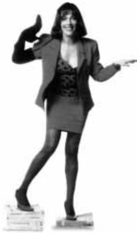
Carmen Maura, 48 años, ex musa y ex protagonista total.

Estos son algunos de los actores y actrices que más han contribuido en los filmes de Almodóvar. Miradlos con atención y en vuestros grupos retomad las escenas que habéis elegido anteriormente y escoged vuestros personajes para vuestras escenas. Escribid el diálogo para las escenas seleccionadas.