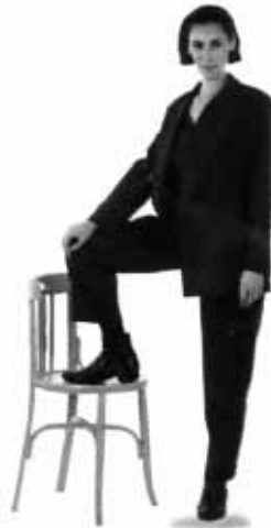
María Barranco, 32 años, chica Almodóvar . Iba a ser Kika .