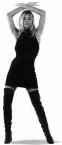
Bibi Andersen, 38 años, amiga entrañable y chica Almodóvar .