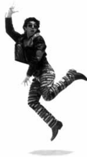
Antonio Banderas, 33 años, debutó en Laberinto...