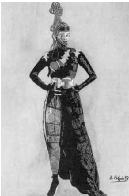
Scarface: dressed to kill . Acrílico sobre papel (42 x 32). 1993. El cine negro, el comic y la moda en Kika

Primero se les pide que lean el guión esquemático de la película y que elijan dos de las nueve escenas que se describen. Los estudiantes tendrán sus preferencias por razones distintas: porque son divertidas, fáciles, dramáticas, entretenidas, originales, etc. En la actividad nº 5 se les invita a observar más de cerca algunos de los personajes más peculiares de las películas de Almodóvar, que seleccionen los actores y/o actrices y creen el diálogo para las escenas que han elegido. Muchas de las escenas se pueden representar por medio de una conversación telefónica. Las frases deberían ser cortas y la representación de estas situaciones o escenas, que aconsejamos, tendría que ser dinámica y ágil.