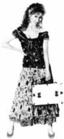
Verónica Forqué, 37 años, protagonista de Kika .