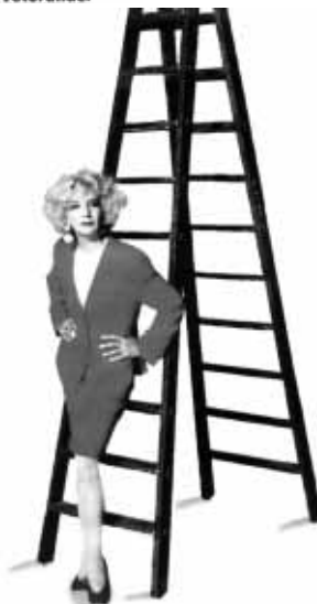
Marisa Paredes, 47 años, la madre de Tacones lejanos .