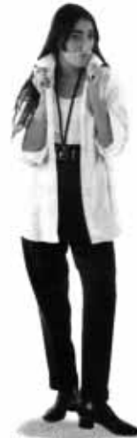
Rossy de Palma, 28 años, chica Almodóvar y belleza imposible .