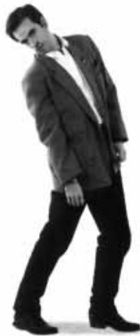
Imanol Arias, 37 años, debutó con Laberinto de pasiones .