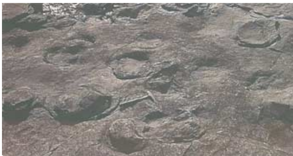
Rastros de dinosaurios saurópodos desplazándose hacia la izquierda. Se ven huellas de la mano y del pie.

Los restos más abundantes y espectaculares de dinosaurios en Asturias se encontraron en la zona marcada con un rectángulo dentro del pequeño mapa. A veces son huesos fosilizados y otras veces son huellas de pisadas o huellas de manos. Los tipos de dinosaurios más representativos del Jurásico asturiano son los siguientes: ornitópodo, terópodo y saurópodo.