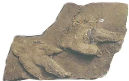
Ícnitas atribuibles a un pequeño dinosaurio bípedo (terópodo).