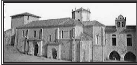
Santo Toribio de Liébana