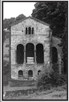
Santa María del Naranco