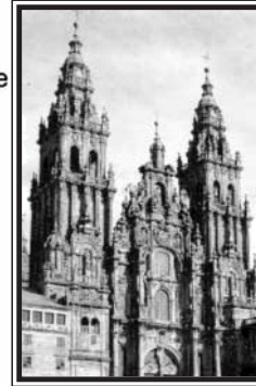
Catedral de Santiago de Compostela