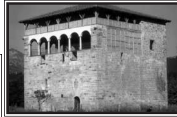
Torre de Muntzaraz